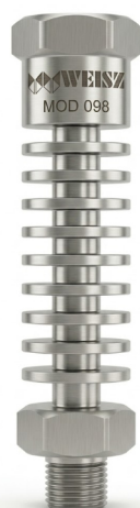
Fig 1. Torre de enfriamiento en acero inoxidable; modelo 098.